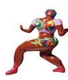
Niki de Saint Phalle