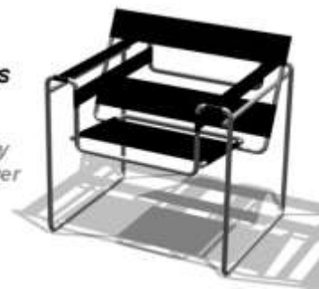
Chaise Wassily de Marcel Breuer