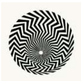
Bridget Riley ( Blaze )

mediation.centrepompidou.fr/education/ressources/ENS-cinetique/ENS-cinetique.html